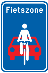
R17. Begin van een fietszone

Op de borden "Voorbehouden weg", "Voetgangerszone", "Fietszone" en "Erf" kan de wegbeheerder ervoor kiezen om de maximumsnelheid in de zone aan te geven, wat des te nuttiger is omdat deze van gewest tot gewest kan verschillen.