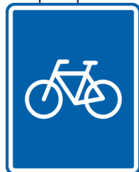
R12. Begin van een niet-verplicht fietspad

De borden F99a en F99c (weg of deel van de openbare weg voorbehouden voor landbouwvoertuigen, voetgangers, fietsers, ruiters en speedpedelecs) zijn samengevoegd in een nieuw bord R9.