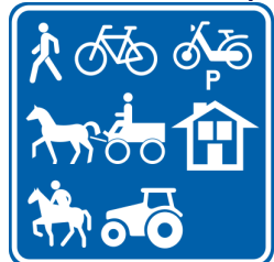
R9. Begin van een weg of van wegen voorbehouden voor het verkeer van de aangeduide weggebruikers

Verschillende aanwijzingsborden worden verkeersborden met bijzondere voorschriften . Deze borden begrenzen een gebied waar één of meer specifieke regels gelden (inzake snelheid, parkeren, inhalen, enz.):